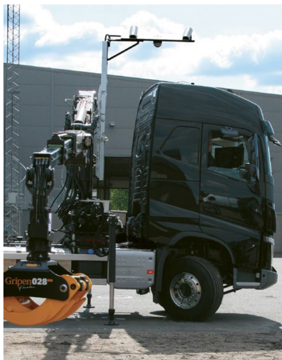
Stereo-kamerorna på kranen ger djup i bilden och visualiserar gripens position i realtid.